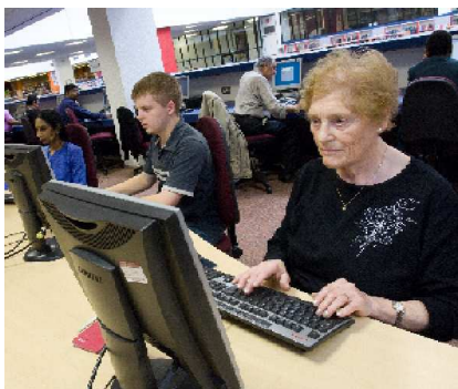
La Comissió Europea s'ocupa dels reptes que planteja a l'aprenentatge permanent l'envelliment de la població a Europa

S'insisteix sobretot en els aspectes que tenen a veure amb les destreses i la formació relacionades amb l'aprenentatge, perquè la Comissió considera que el paper de l'aprenentatge permanent constitueix un àmbit decisiu pel que fa a respondre a tota una sèrie de reptes [econòmics]: "l'abast dels canvis econòmics i socials actuals, la ràpida transició a una societat fonamentada en el coneixement, i la pressió demogràfica resultat de l'envelliment de la població a Europa són tots reptes que exigeixen un nou enfocament de l'educació i la formació, dins el marc de l'aprenentatge permanent" . (Comissió Europea, 2000)