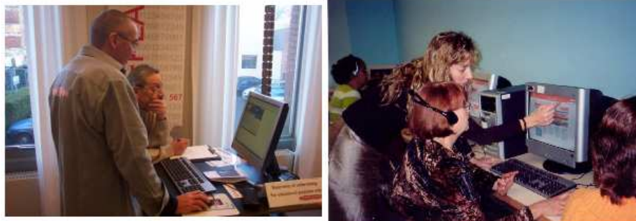
La formació dels usuaris pot anar des de la formació d'unes quantes persones fins a classes en una aula

Formació d'una classe: es pot ensenyar a un grup més gran, d'unes 15 persones, per exemple a utilitzar internet o a fer cerques a la base de dades de la biblioteca, amb demostracions en un monitor gran i exercicis pràctics.