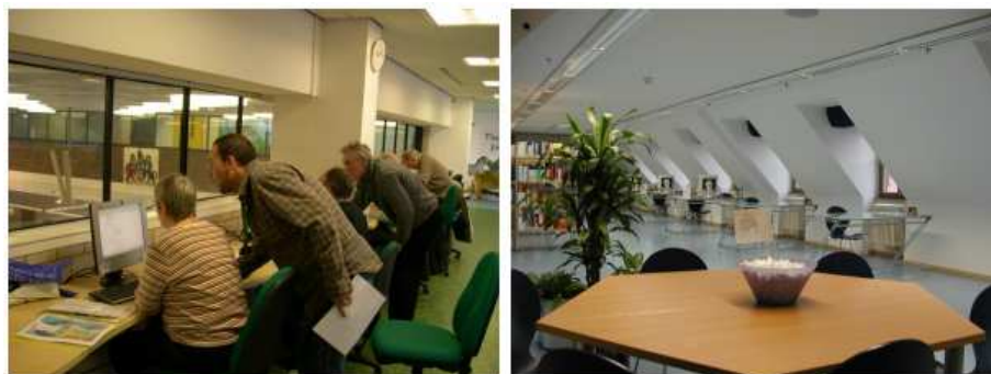
Exemples d'espais d'aprenentatge flexibles i acollidors de Sutton (Anglaterra) i Würzburg (Alemanya)

En planificar una biblioteca nova, o la renovació d'una biblioteca existent, caldria tenir en compte les instal·lacions per a un Centre d'Aprenentatge Obert. La formació podria tenir el seu propi espai, però hauria de ser un espai prou flexible perquè se'l pogués utilitzar per a altres propòsits quan no hi hagués formació.