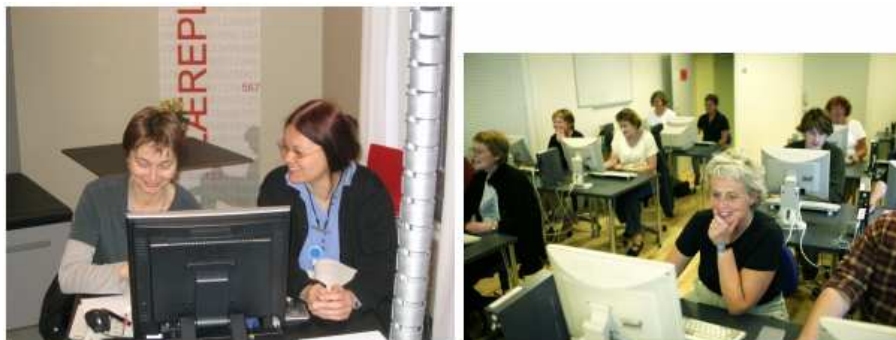
Hi ha molts mètodes disponibles per a la formació del personal: des de les mentories fins a les classes en una aula