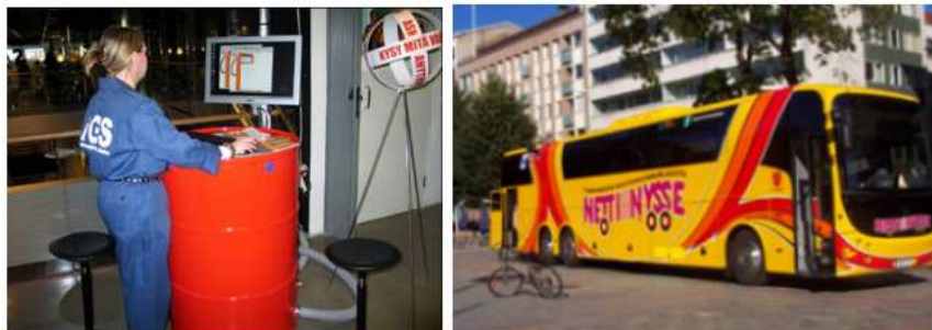
La flexibilitat en l'entorn físic és important. A sobre: Information Gas Station (Benzinera de la Informació) i autobús amb Internet a Finlàndia