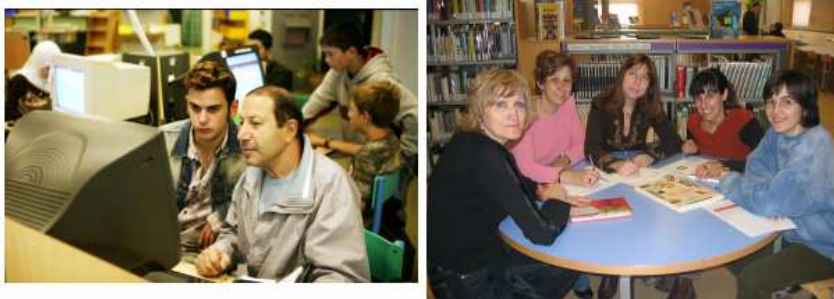
Exemples d'entorns d'aprenentatge en biblioteques públiques

El material de marketing hauria d'incloure el logotip de la institució; les imatges també són importants.