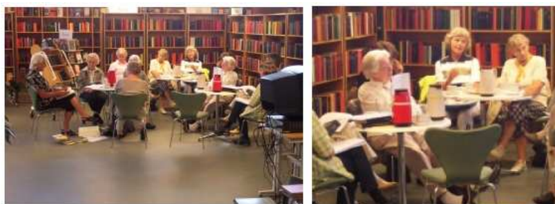
Aprentatge permanent en les biblioteques públiques vol dir moltes coses. A sobre: una reunió del "Cafè literari"

Els mòduls es desenvolupen i actualitzen constantment. Segons la matèria, el programa de formació sistemàtic varia i pot estar format per pocs mòduls o per tot un ventall de mòduls. Els participants poden ser integrants de diverses institucions, per exemple arxius, biblioteques i museus, segons la matèria.