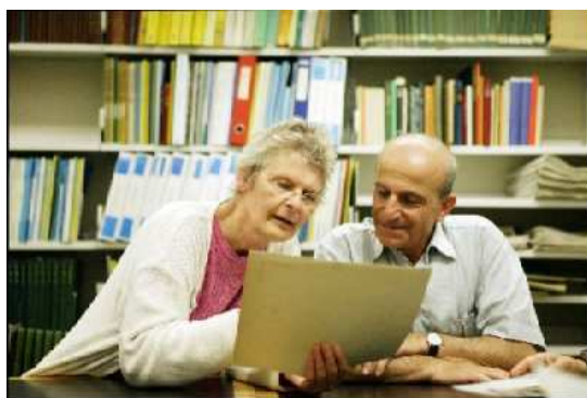
L'aprenentatge pot adoptar molts patrons i formes: l'aprenentatge no formal o informal és tan vàlid com l'aprenentatge formal

Al Regne Unit, l'MLA (Museums, Libraries and Archives Council) –l'organisme que s'encarrega de proporcionar direcció i suport estratègics al sector de les biblioteques, els museus i els arxius– ha adoptat la definició de la Campaign for Learning en la seva iniciativa Inspiring Learning for All, que compta amb una caixa d'eines per avaluar quin suport donen aquestes institucions a l'aprenentatge. ( http://www.inspiringlearningforall.gov.uk/default.aspx?flash=true )