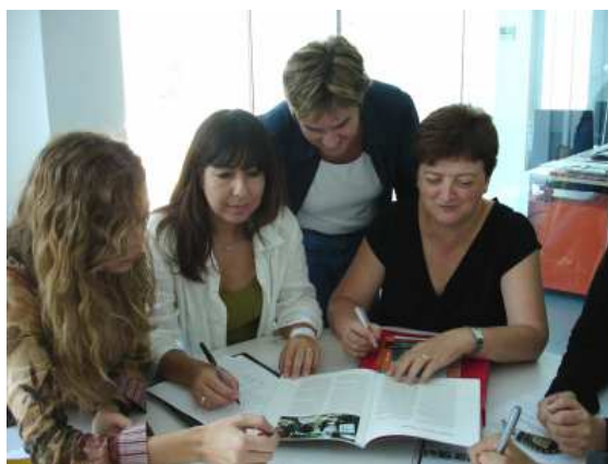
Aprentatge en petits grups informals (membres del personal de Barcelona)