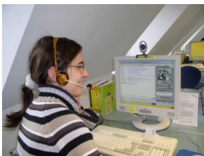
El projecte PuLLS s'ha ocupat de diverses tecnologies, per exemple, videoconferències (Würzburg)

Competència informacional és saber quan i perquè necessiteu informació, on trobar-la, i com avaluar-la, utilitzar-la i comunicar-la d'una manera ètica. (CILIP, 2004)