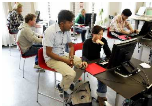
Què és aprenentatge? Les directrius ofereixen una definició de l'aprenentatge permanent

Les directrius descriuen les "millors pràctiques" i fan suggeriments sobre: