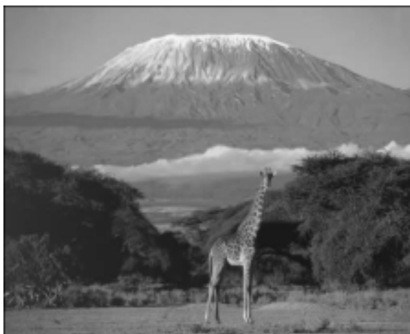
Neus perpètues del Kilimanjaro (Kènia)

Jenkins, Mark. Rumbo a Tombuctú: una travesía en kayak por el río Níger . Barcelona: Ediciones B, 1998