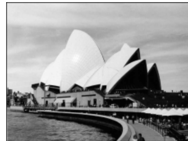
Òpera de Sidney (Austràlia)