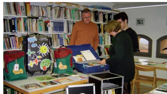
Parc de Collserola

Els centres són el resultat d'una iniciativa comuna de la Diputació de Barcelona i els ajuntaments de Terrassa, Granollers, Gavà, Sant Celoni, Mataró, Vilanova i la Geltrú, Vilassar de Dalt, Sant Quirze de Besora, Santa Margarida i els Monjos i Arbúcies. Al centre d'Arbúcies, a més de l'Ajuntament de la població, també hi intervé la Diputació de Girona.