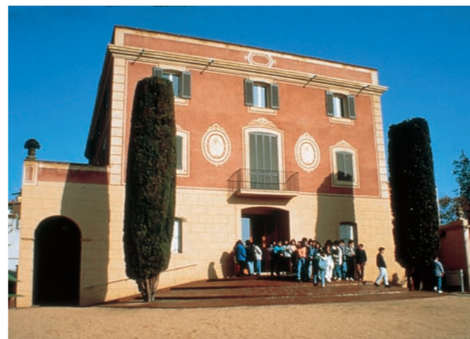
Museu de Gavà