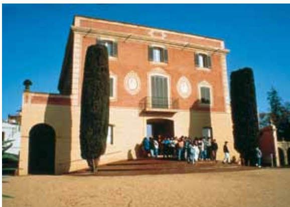
Museu de Gavà