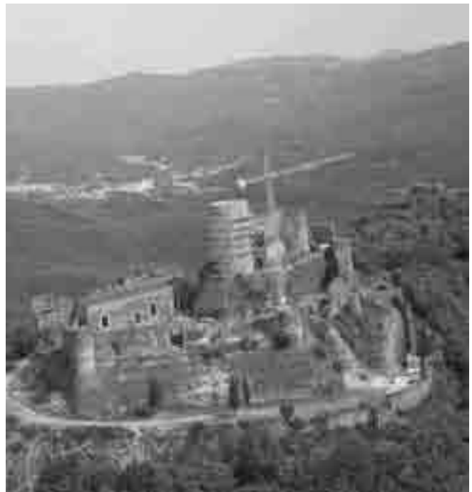
Foto 1. Vista aèria del castell de Montsoriu.

Arquitectònicament, l'espai del castell en el qual s'observa d'una manera més clara el procés de transformació d'un castell romànic a un gran palau gòtic és el pati d'armes. Aquest recinte és on per altra part han tingut lloc la major part de les intervencions arqueològiques portades a terme en aquests darrers anys.